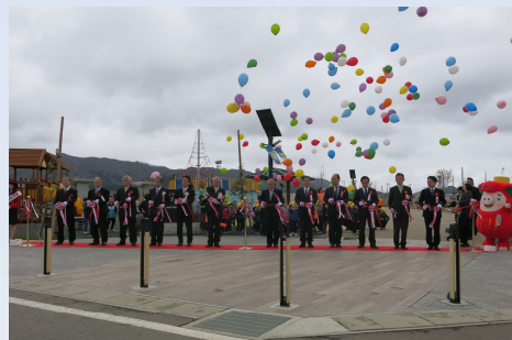
事業竣工式(平成31年4月)