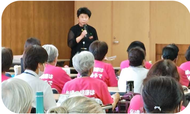
R6.611食生活改善推進員リーダー研修会

イー歯トープ8020出前健口講座は随時受け付けておりますので、お問い合わせは岩手県口腔保健支援センター(下記お問い合わせ)または、下記の二次元バーコードから読み込み可能です。必要事項を記入のうえお申し込みください。ご連絡お待ちしております。