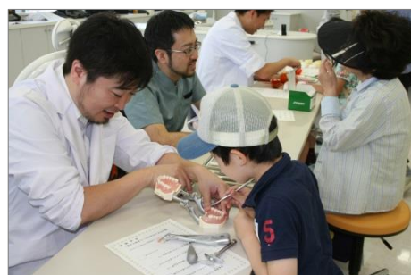
体験コーナーの様子

当センターも体験学習コーナーの一つとして「むし歯活動検査」を実施し、参加者に口腔衛生の意識を高めてもらいました。