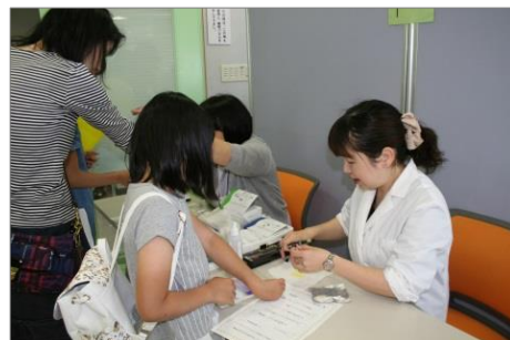
むし歯活動検査コーナーの様子