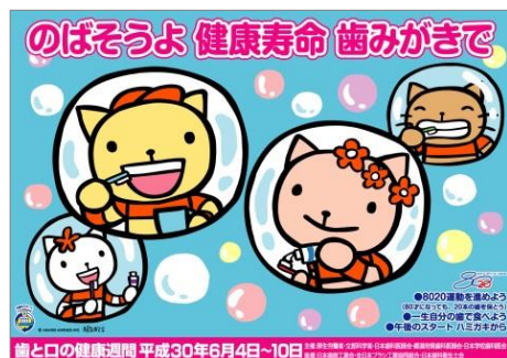
平成30年度「歯と口の健康週間」ポスター