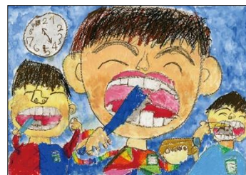
小学校1～3年生の部 金賞作品