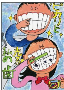
小学校4～6年生の部 金賞作品

今年度の岩手県よい歯のコンクール（岩手県知事表彰）は、コンクール3部門のうち「イー歯トープ8020部門」のみ実施されました。