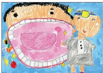
保育園の部 金賞作品