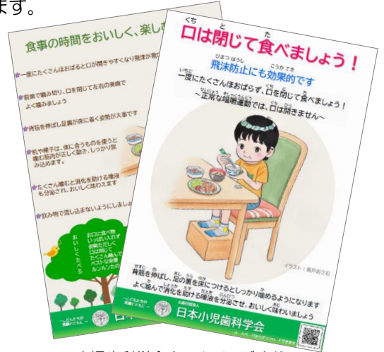
小児歯科学会ホームページより

また、当センター発行のイー歯トープ8020健口情報シリーズの「生涯を通じたお口の健康 - よくかんで食べる習慣づくり -」では、よくかんで食べるために心がけることを掲載していますので、合わせてご確認ください。