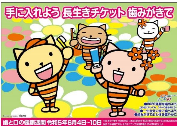
「令和5年度歯と口の健康週間」ポスター