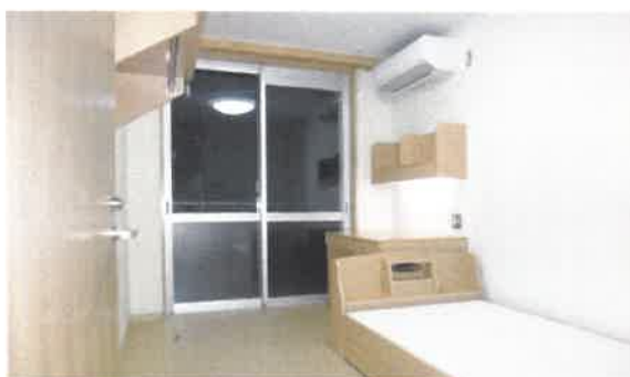
居 室 (1 人部屋)