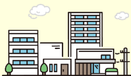
地域の見守り・訪問活動