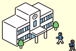
小学校の行事参加