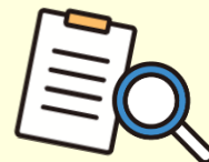
市町村の調査協力