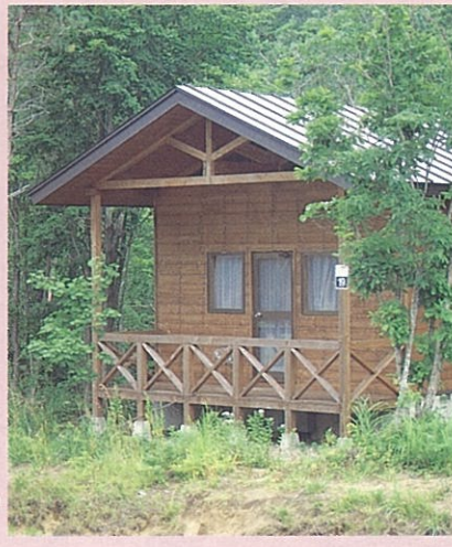
●岩手山焼走り 国際交流村