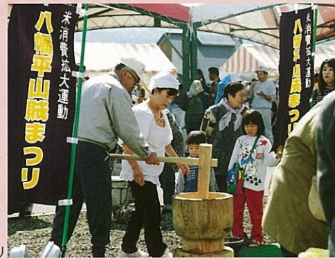
●八幡平山賊まつり