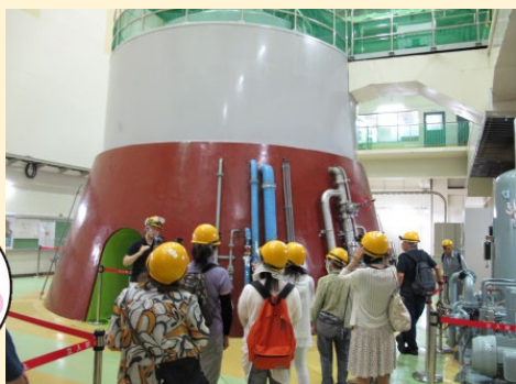
岩手県企業局にて