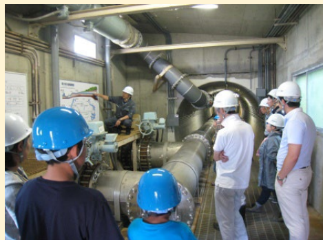
旧松尾鉱山・新中和処理施設にて