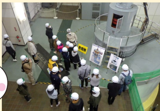
岩手県企業局にて