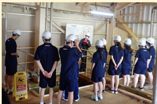
旧松尾鉱山・新中和処理施設にて