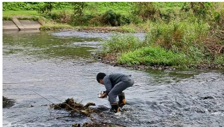
河川の底質調査の様子