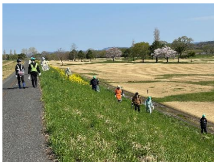
北上川流域清掃活動の様子