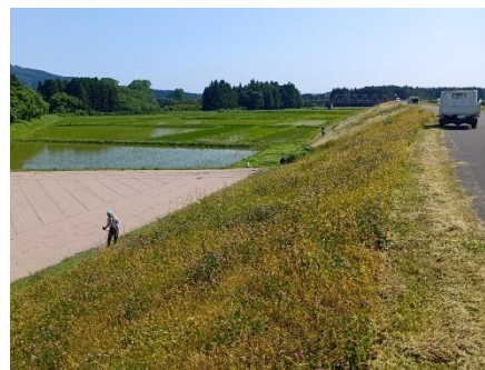
堤防の除草作業の様子