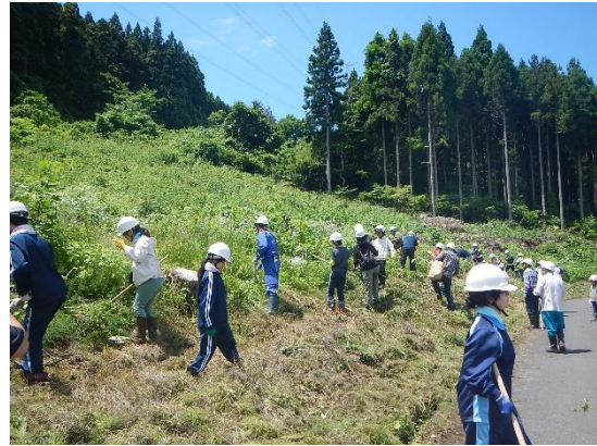
地域住民・企業による下草刈りの様子