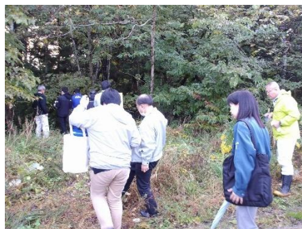
不法投棄合同パトロールの様子