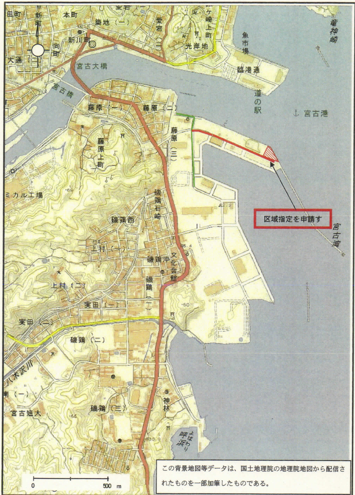
区域指定対象 周辺位置図