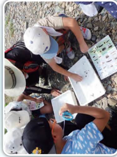
岩手銀行地域貢献部 [中津川]