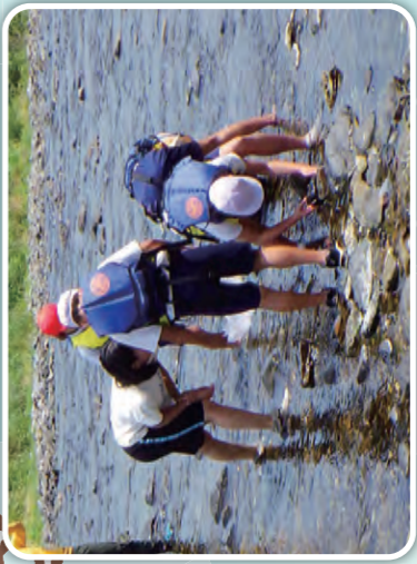
陸前高田市立矢作小学校 [矢作川]