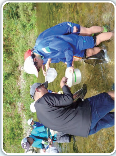
宮古市立重茂小学校 [重茂川]