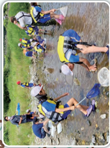
住田町立世田米小学校 [気仙川]