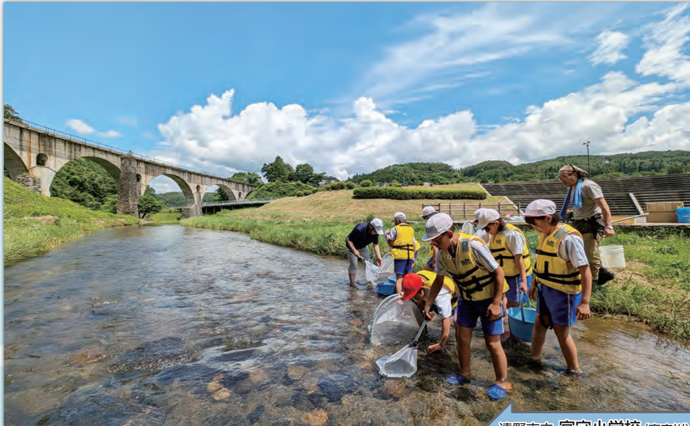
遠野市立 宮守小学校 (宮守川)

川の中には、さまざまな種類の水生生物がすんでいます。川底にすんでいる水生生物の種類や数を調べることで、その川の水がどのくらいきれいなのか知ることができます。