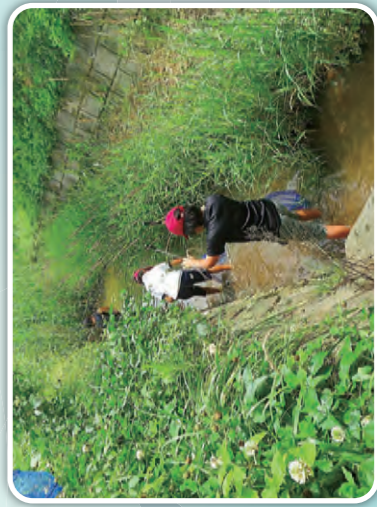
老松みどりの郷協議会 [藤田川]