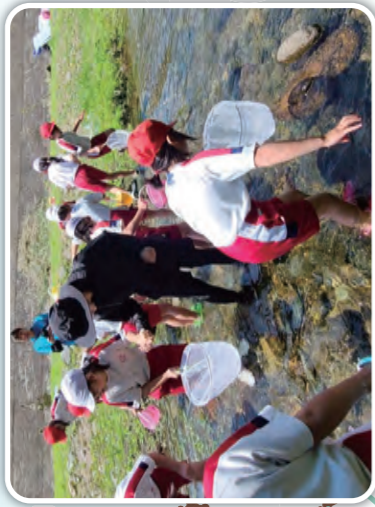
釜石市立釜石小学校 [小川川]