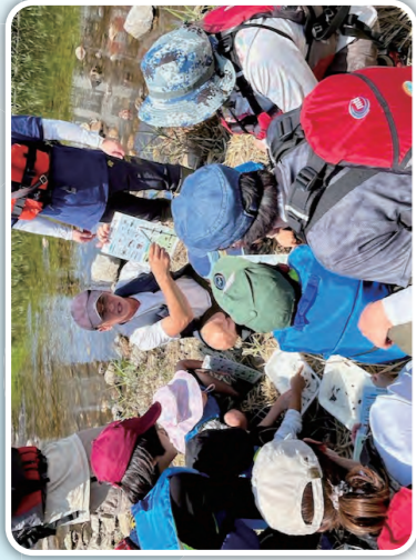
盛岡市中央公民館 [中津川]