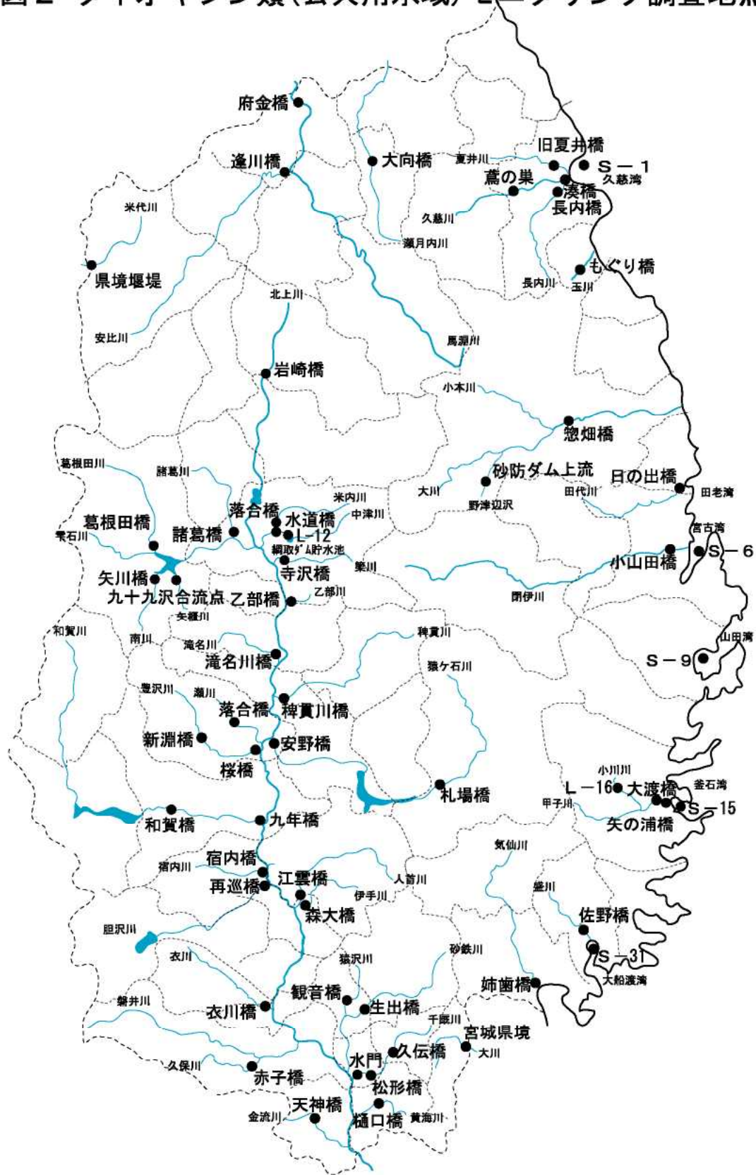
図2 ダイオキシン類(公共用水域)モニタリング調査地点