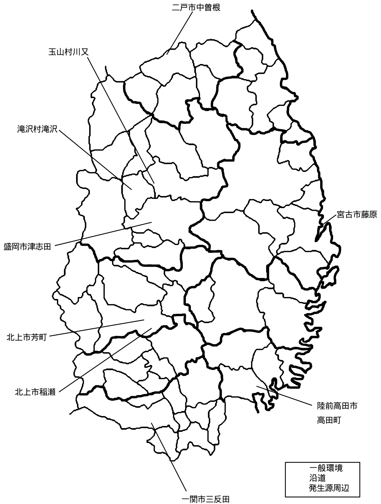
図 1 ダイオキシン類（環境大気）モニタリング地点