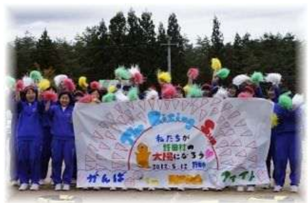
(復興教育に取り組む野田村立野田中学校の皆さん)