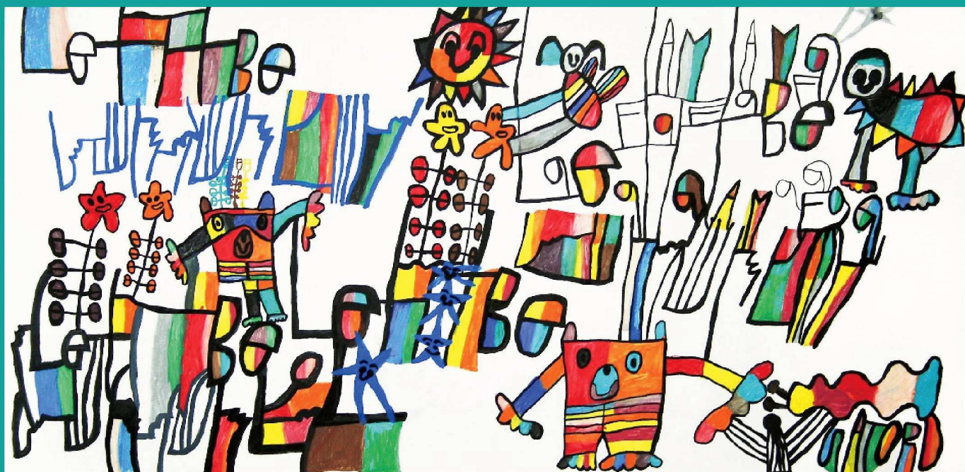
「Let it be」小林寛/2007（るんびにい美術館）