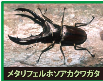
メタリフェルホソアカクワガタ

野外に出ると、日本のカブトムシやクワガタの餌やすみかをうばったり、交雑したり、昆虫の病気を広めたりします。