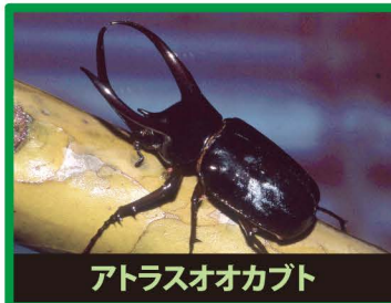
アトラスオオカブト