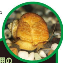
かんしょう用の ゴールデンアップルスネール

つかまえても、他の場所に持って行かないでね。 飼っている貝は、池や川に放さないでね。