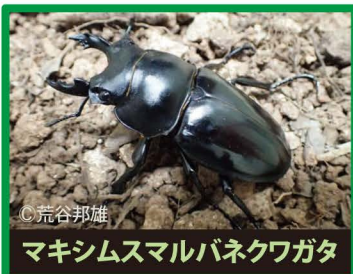
マキシムスマルバネクワガタ