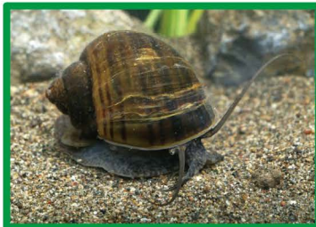
スクミリンゴガイ