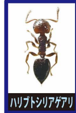
ハリトシアゲアリ