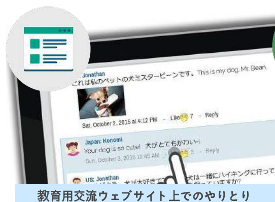
教育用交流ウェブサイト上でのやりとり