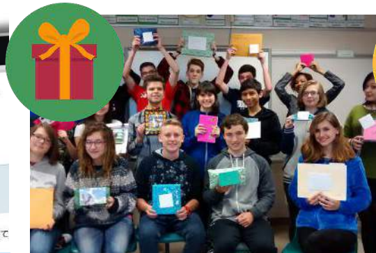
お土産エクステンジ