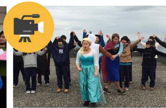
ビデオ制作コンテスト