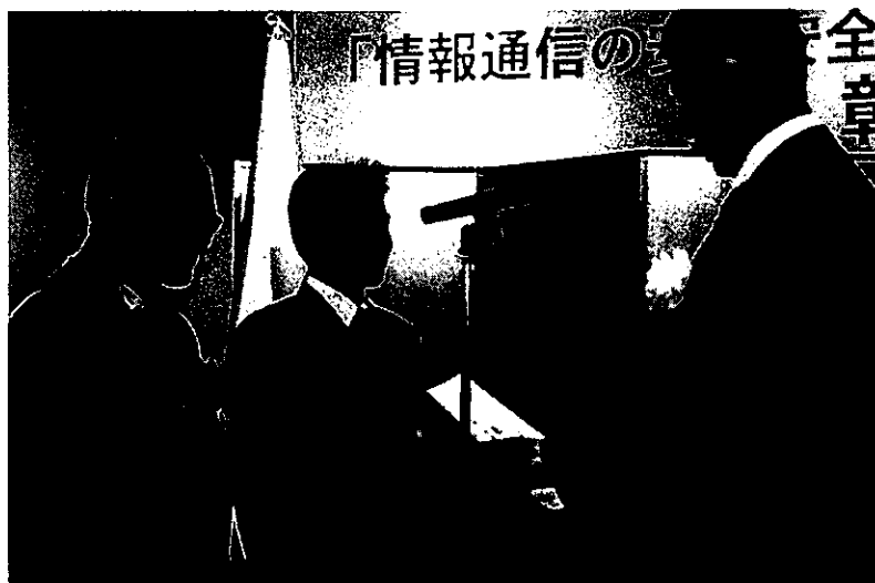
平成29年度表彰式(平成29年6月5日) あかま二郎総務副大臣より総務大臣賞(都城聖ドミニコ学園 高等学校)を授与