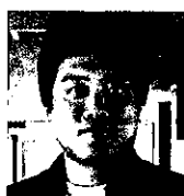
NPO法人カタリバ 東北事業部ディレクター (大館町教育委員会教育専門官)