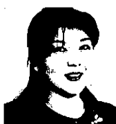
国立教育政策研究所 生涯学習政策研究部 総括研究官