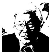
千葉敬愛短期大学 学長