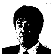
栃木県教育委員会事務局 生涯学習課ふれあい学習担当 課長補佐