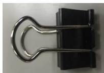
まとめて左上 クリップ止め

※様式毎にホッチキス等で止めていただく必要はありません。提出資料をまとめて1部ずつクリップ止めし、20部送付してください。