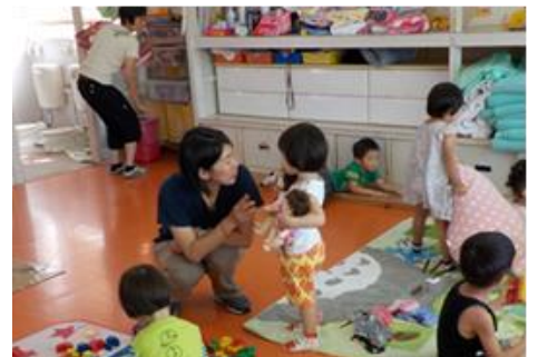
＜横手市＞ 保育者及び小学校教員による 一日職場体験事業