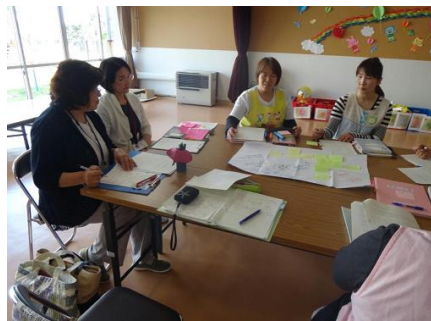
＜男鹿市＞ 教育・保育アドバイザーの 進行による研究協議