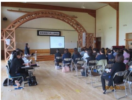
＜大館市＞ 大学との連携を図った研修 機会の提供