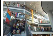
(学校法人立命館 立命館高等学校)