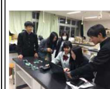
(福島県立福島高等学校)