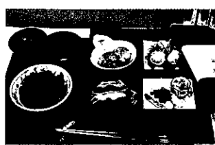
第1回全国大会優勝作品 北海道三笠高等学校