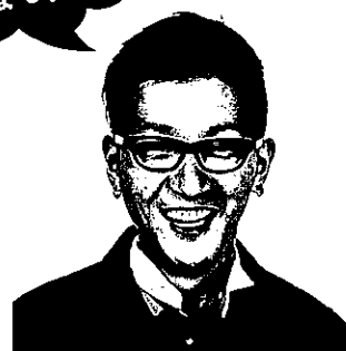
ゲスト審査員は 口バートの馬場さん！