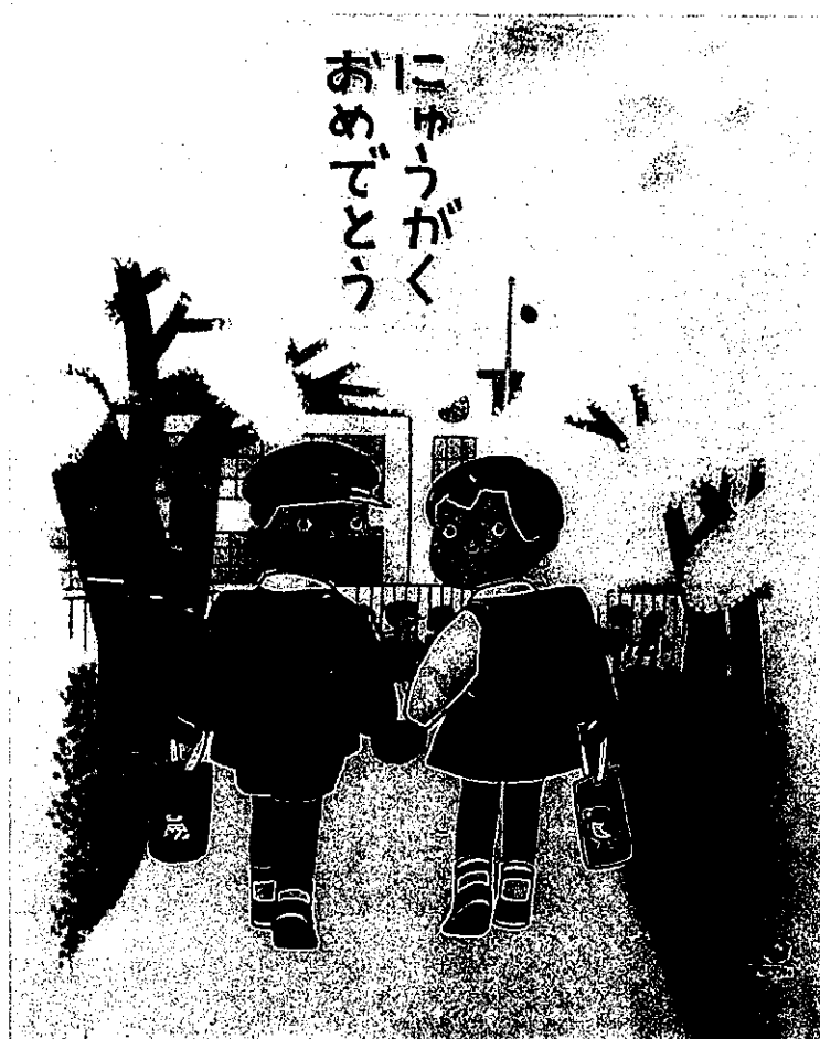
(教科書無償给与袋の原画)

平成二十八年度に検定を行った教科書を全国七会場で展示しています。 新しい教科書を手にとって御覧になりませんか？