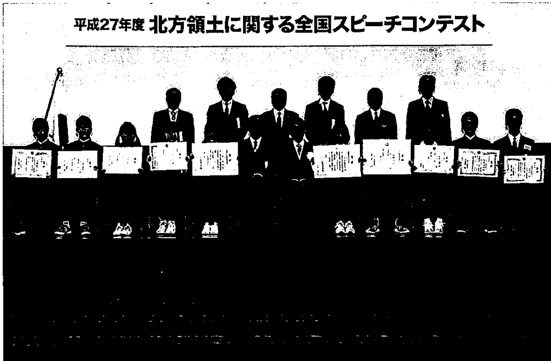
(発表者及び審査委員集合写真)

本コンテスト開催にあたり、全国から応募いただきました中学生の皆さん、学校関係者、保護者の方々、全国の都道府県市区町村並びに北方領土返還要求運動都道府県民会議等関係者の方々のご理解、ご協力を賜り、厚く御礼申し上げます。