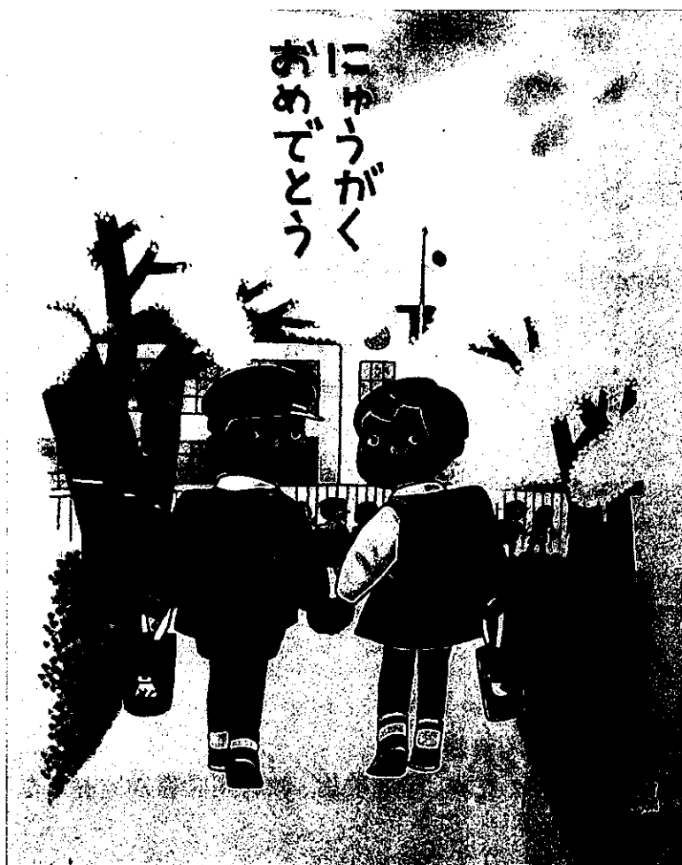
(教科書無償給与袋の原画)

平成二十七年度に検定を行った教科書を全国七会場で展示しています。 新しい教科書を手にとって御覧になりませんか？