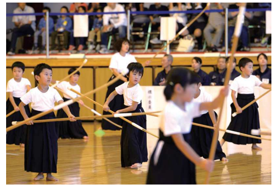
一戸町では国体開催誘致に取り組みだした2008年からなぎなた教室をスタートしました。現在も多くの子どもたち、また健康増進を目的とする中高年の方が活発な活動を続けています

「一戸町のような、規模としては大きくない町で、全国大会を成功させられたこと。そのことによる自信や、自分たちに対する誇りを持てたことが国体を経ての一番の財産ではないでしょうか。今回は国体のなぎなた競技でしたが、それに限らず、一丸となって同じ方向を向いて取り組めば、こういうことができるかもしれない。というような前向きな意識をそれぞれが強めたように感じますし、そういう考え方というものは町の活性化には欠かすことができません。今後の一戸町にとって大きな出来事だったと思います」 国体の開催は、そこに携わった町民の内面にも大きな変化を与えました。この気運を生かし、一戸町では「なぎなたの町」になることを目指しています。そのモデルケースとなるのが岩手町の取り組みです。47年前に岩手県で行われた国体でホッ