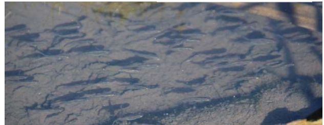
初冬期のメダカ水路