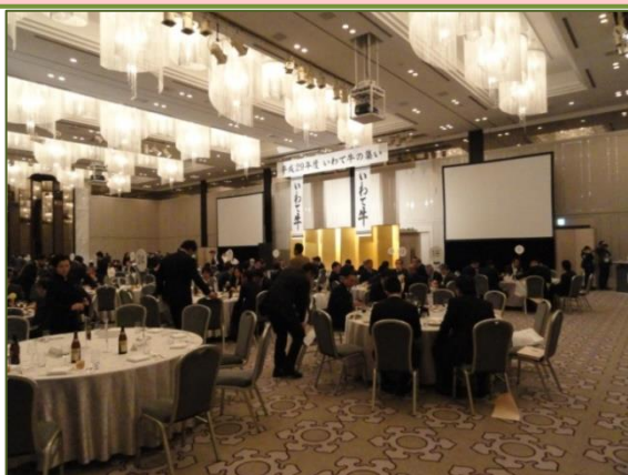
写真1 会場風景～生産者とバイヤーの交流～

平成29年度のいわて牛取扱推奨店は新規11店を加え、県内外、さらには海外を含めて281店が登録されており、「いわて牛」の名前は国内外に広まっています。