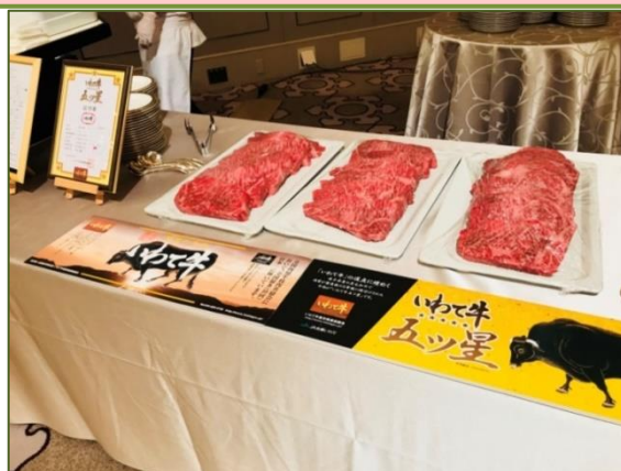
写真2 いわて牛五ツ星ステーキ