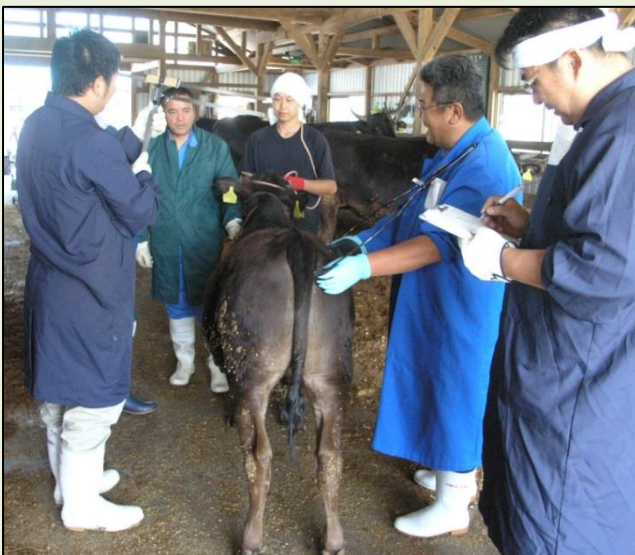
測尺して発育を確認

巡回指導は、3か月毎に実施し、共進会に向けて最高の牛を出品できるよう、農家・関係者が一体となり、取り組んでいきます。