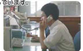
関係省庁との調整、企画立案

食の安全・安心、動物愛護、自然鳥獣保護、感染症対策に関わる施策の企画、事業の実施に取り組んでいます。