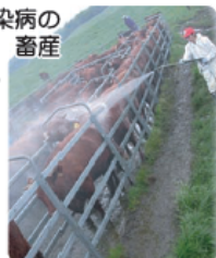
放牧地での畜体消毒