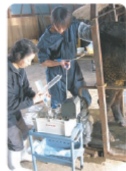
体内受精卵の回収