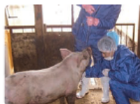
家畜伝染病予防法に基づく検査