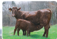
いわて牛やいわて短角牛の流通促進

畜産の振興のため、生産から流通までの総合的な施策立案、事業実施に取り組んでいます。