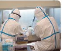
BSL3検査室での検体操作