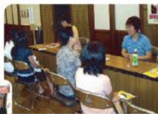
愛護動物の飼い方相談