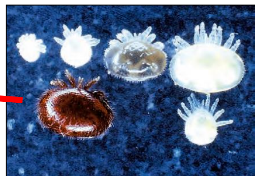
ミツバチヘギイタダニ