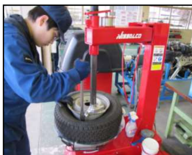
タイヤチェンジャーを 使用(1年生)