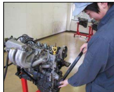
タイミングベルトの 脱着(1年生) 1