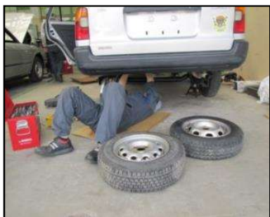
手始めにタイヤ交換 (1年生)