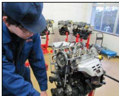
タイミングベルトの 脱着(1年生) 2