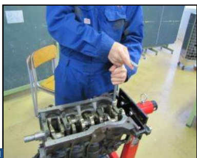
クランクシャフトの 脱着(1年生) 1