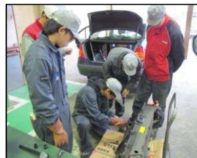
ハイブリッド車を 使った講習(2年生) 2