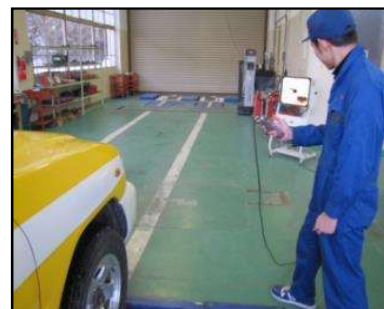
スピードメータによる 速度測定(1年生)