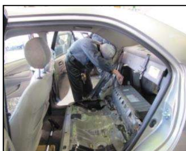
ハイブリッド車を 使った講習(2年生) 1