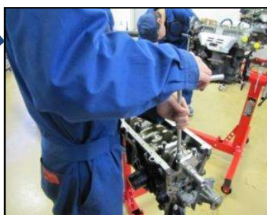
クランクシャフトの 脱着(1年生) 2