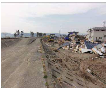
被災後状況 (左岸堤内側)