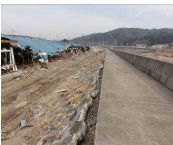
被災後状況 (左岸堤内側)