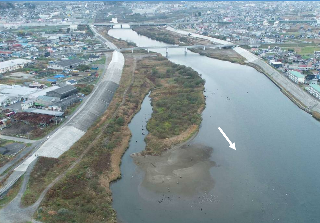
完成年月：令和3年3月