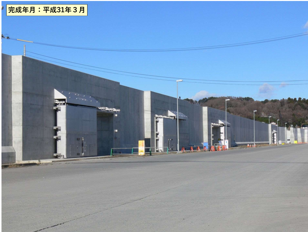
完成年月：平成31年3月