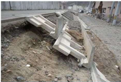
既存防潮堤背後の被災状況