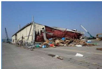
港湾内施設の被災状況