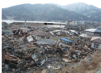
津軽石川 金浜地区付近