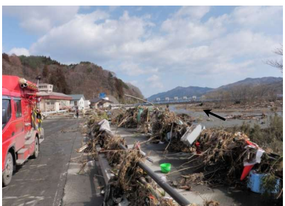
津軽石川 津軽石地区付近