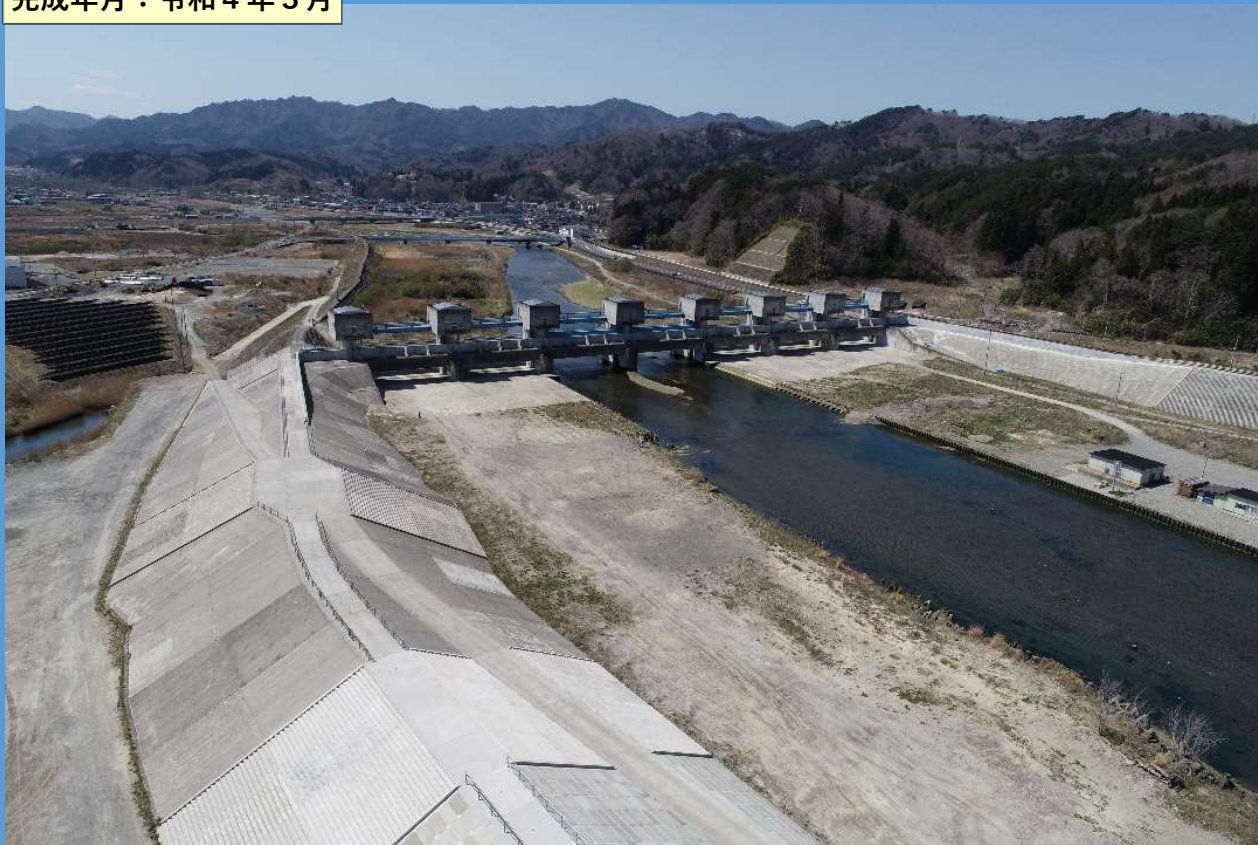
完成年月：令和4年3月