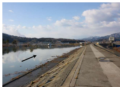
津軽石川 赤前地区付近