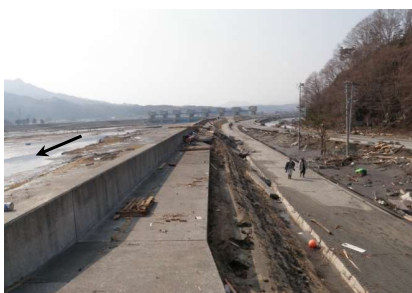
津軽石川 金浜地区付近