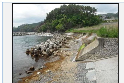
消波ブロッカー一部流失