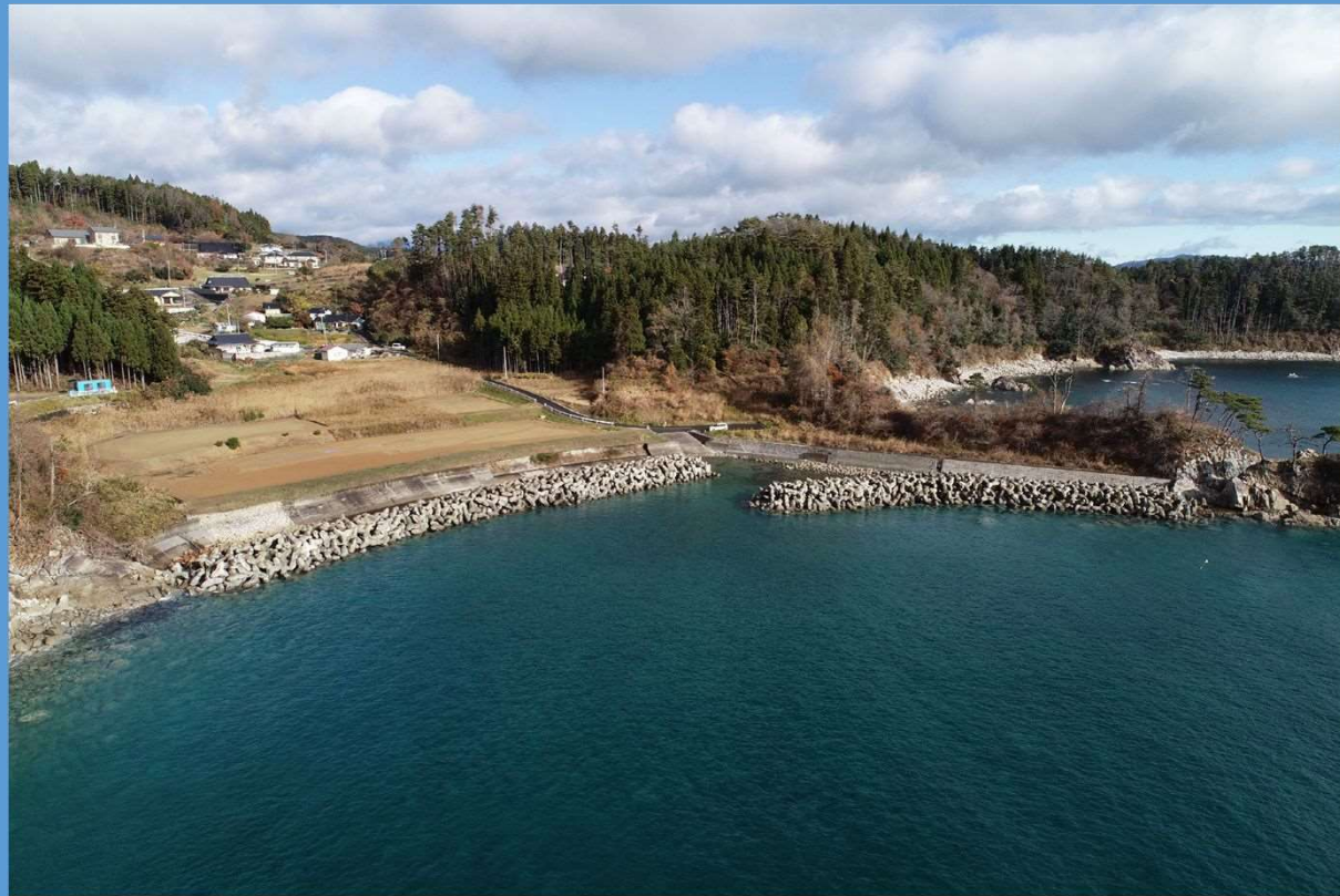
完成年月：平成25年1月