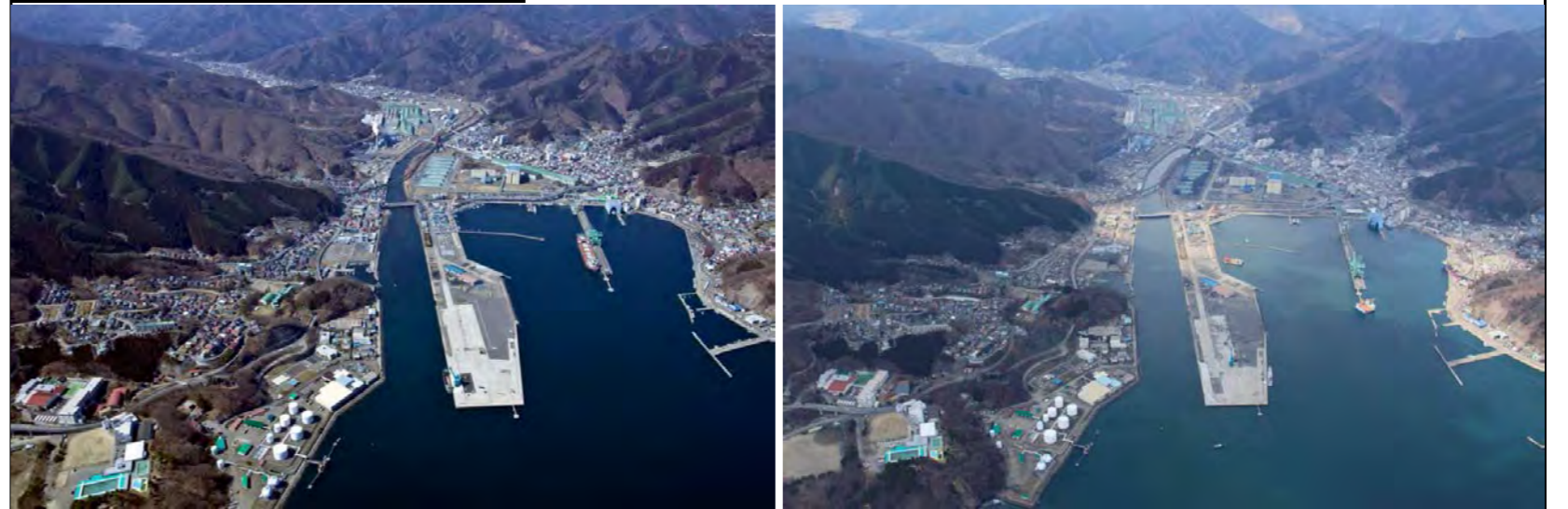
被災前状況 H22.3.19 撮影