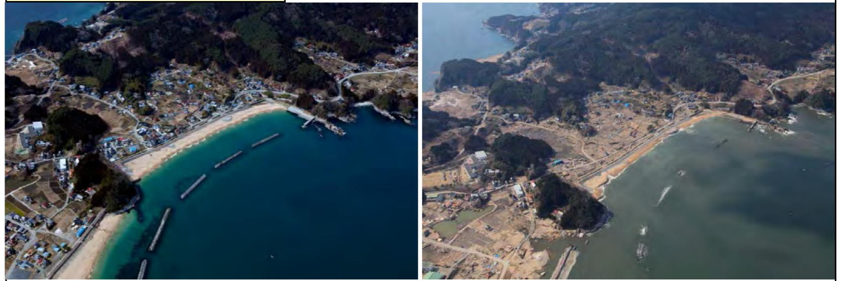
被災前状況 H22.3.14 撮影