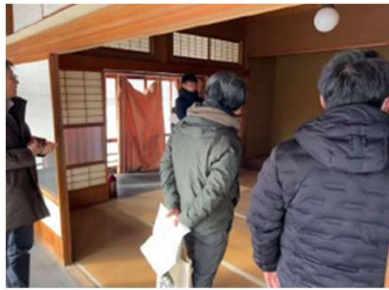
歴史的な建物の活用方法に関する勉強会