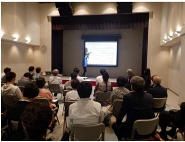
地域が抱えている課題をみんなで考えるワークショップ