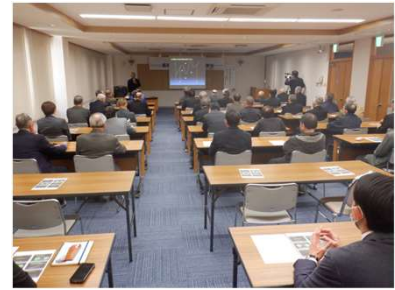
これからのまちづくりに向けた講演会