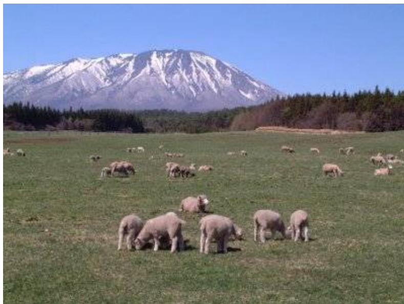
雫石町小岩井農場から見る 岩手山の景観

http://www.pref.iwate.jp/~hp0604/01machi/nkeikan/