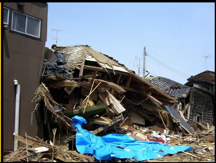
H19.7 新潟県中越沖地震被害住宅