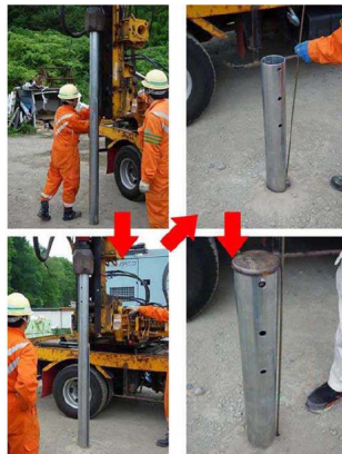
施工・測定試験状況

⑥考察:上記結果に加え、本試験による作業員、第三者に対する事故等の発生はなかったことにより実フィールドでの展開が可能と考える。