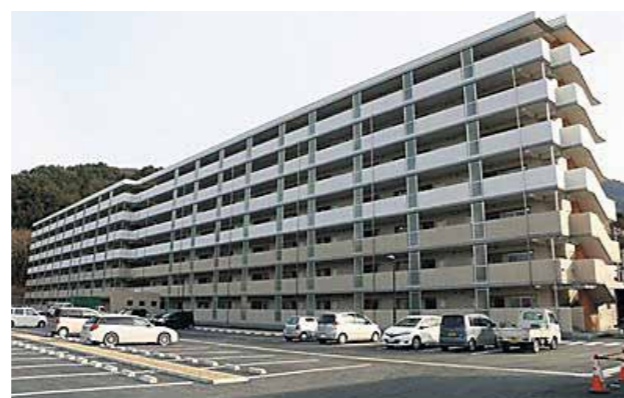
災害公営住宅 (釜石市)