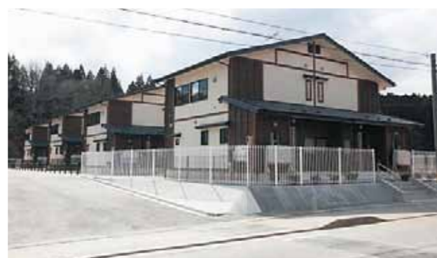
災害公営住宅 (野田村)