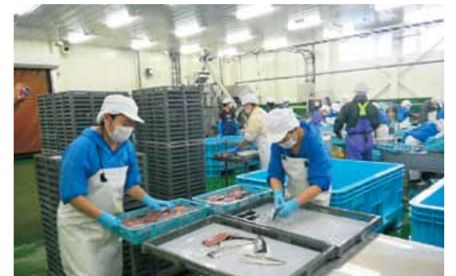
再建した水産加工工場