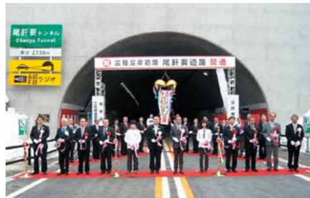
(尾野要道路平成 26 年 3 月)