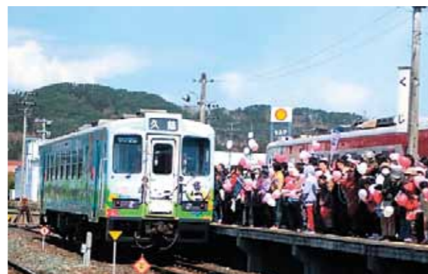
三陸鉄道全線運行再開 (平成 26 年 4 月)