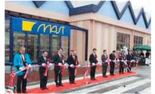
再開した商業施設