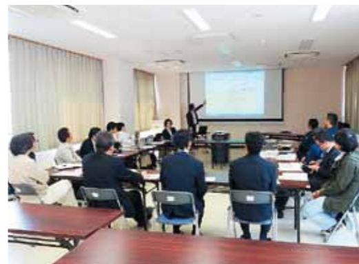
システム導入市町村の意見交換

岩手県及び支援プロジェクトチームが定期的に市町村を訪問し、システムの運用支援を行うとともに、意見交換会や意見交換サイト等の活用によりシステム利用者の意見を集約のうえ、随時、システム改修を実施しています。