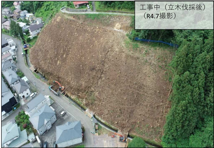
工事中 (立木伐採後) (R4.7撮影)