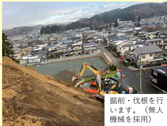
掘削・伐根を行います。（無人機械を採用）