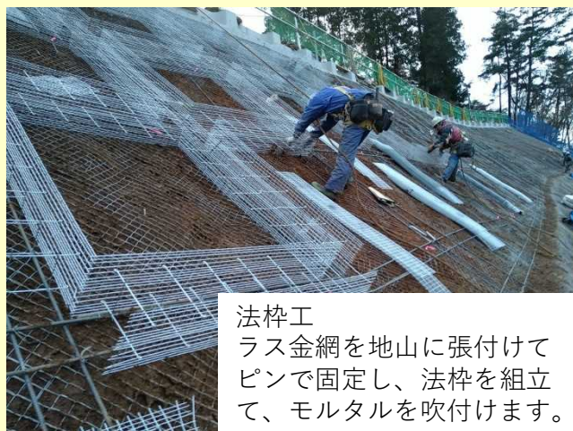
法枠工 ラス金網を地山に張付けてピンで固定し、法枠を組立て、モルタルを吹付けます。