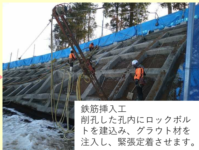
鉄筋挿入工 削孔した孔内にロックボルトを建込み、グラウト材を注入し、緊張定着させます。