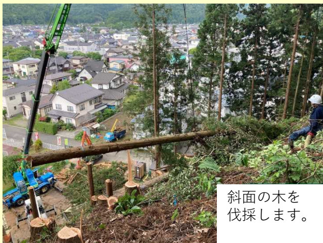
斜面の木を伐採します。