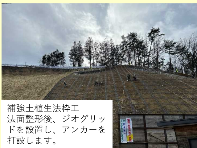
補強土植生法枠工 法面整形後、ジオグリッドを設置し、アンカーを打設します。