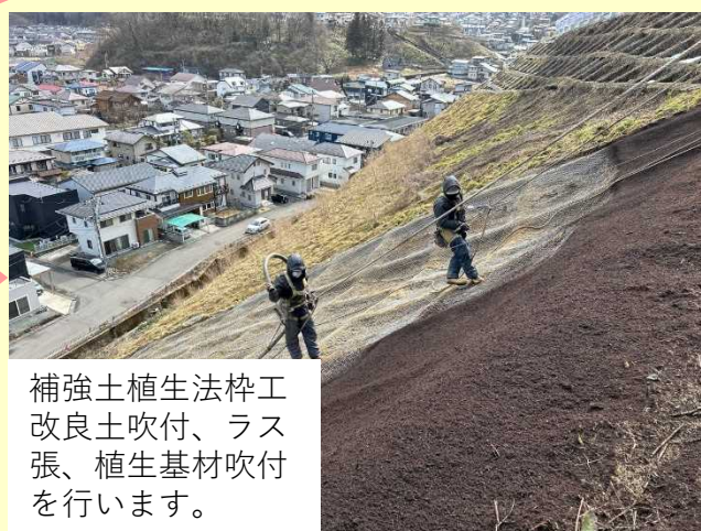
補強土植生法枠工 改良土吹付、ラス張、植生基材吹付を行います。