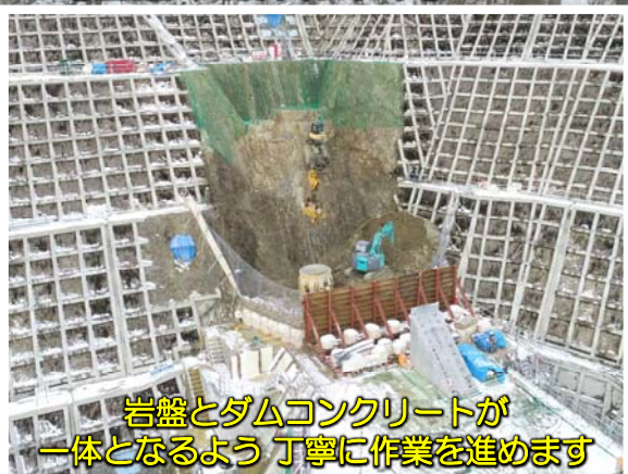
岩盤とダムコンクリートが 一体となるよう丁寧に作業を進めます