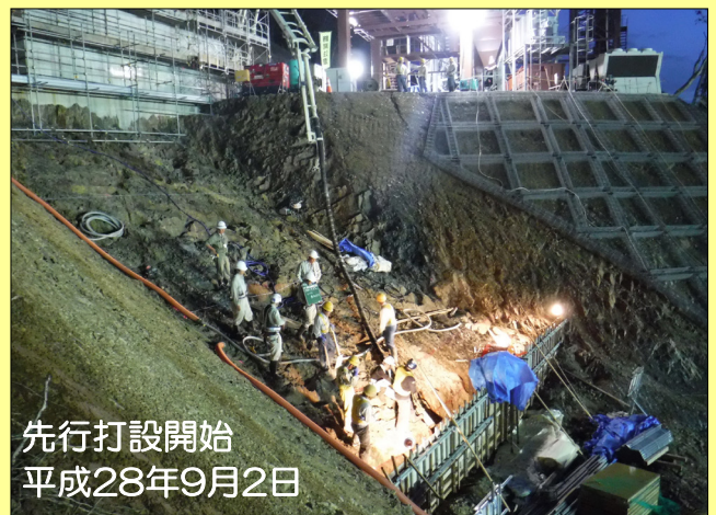
先行打設開始 平成28年9月2日