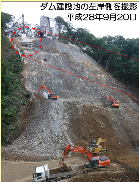
ダム建設地の左岸側を撮影 平成28年9月20日

平成29年4月に着手する本格的なコンクリート打設作業で必要となるスペースを確保するため、 ダム左岸の最も端の部分 を先行して打設しています。